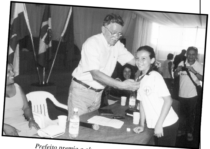
Prefeito premia a aluna vencedora da redação