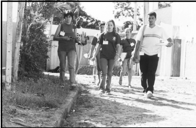
A Campanha Unidos contra Dengue está mobilizando cerca de cem pessoas que irão de casa em casa orientar os moradores.