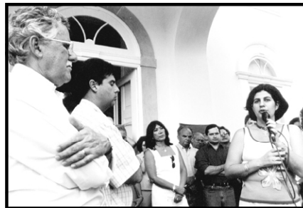
Momento de inauguração da clínica

vencer o preconceito. E garantiu que a localidade será abençoada por ajudar a dar nova vida a pessoas tão necessitadas. Esta é a segunda clínica do Estado. Com capacidade para atender até 90 pacientes, está composta além de área de recepção e sala de atendimento, sala de reuniões, sala de cuidados clínicos intensivos, dormitórios, capela, centro de convenções, quadra poliesportiva, biblioteca, farmácia, cozinha e enfermarias. A nova clínica está localizada no antigo Patronato de Menores da Fazenda Monte Scylene. A nova destinação mantém de pé totalmente restaurado o solar construído em 1866 e que pertencera ao Duque de Caxias e ao Conde D'Eu.