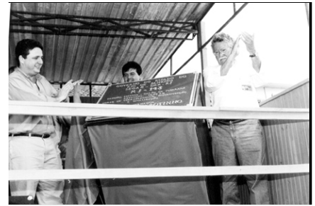
Momento de inauguração da estrada

Na inauguração da Clínica Pública de Recuperação de Dependentes Químicos, a emoção estava presente. Garotinho fez questão de ressaltar que ela só foi construída ali porque o povo de Barão de Juparanã soube