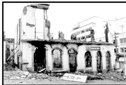
Casarão das Artes após o incêndio

A tristeza tomou conta das ruas de Valença. Nas primeiras horas da quarta-feira, dia 28 de novembro, o centro da cidade foi despertado por um incêndio que destruiu totalmente o Casarão das Artes. O prédio histórico, construído em 1855, localizado na esquina de Rua dos Mineiros com a Rua Padre Luna, foi consumido rapidamente pelo fogo. Além da perda da arquitetônica, a área cultural da