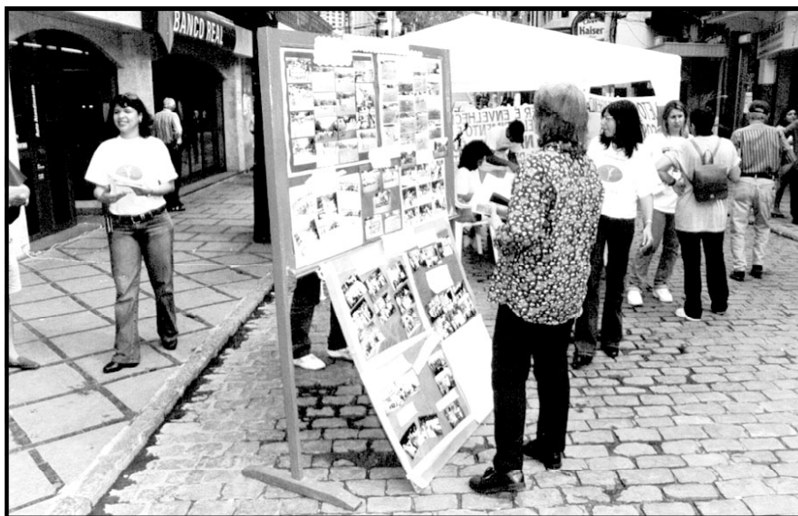
A Semana do Idoso marcou presença na Rua dos Mineiros com várias atividades

Projeto Idade Ativa: Idealizado pela Secretaria Municipal de Esporte e Lazer tem o propósito de formar grupos de idosos, com idade superior a 50 anos, para dar qualida-