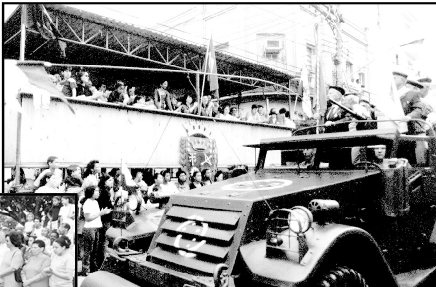
O desfile dos ex-combatentes emocionou os valencianos