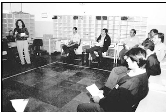
Palestra de preparação dos carteiros para a campanha

que acontecerá durante todo mês de outubro, eles passarão por um treinamento que será realizado no próximo dia 14, pela Secretaria Municipal de Saúde. Os carteiros estarão com uniformes diferentes, usando uma camisa da campanha, cedida pelo Ministério da Saúde e identificados por crachá.