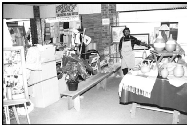
Artesanato tem forte presença no Domingo no Parque.

A festa é finalizada com animado forró que segundo os organizadores, já virou tradição e o ponto alto em todas as edições da feira.