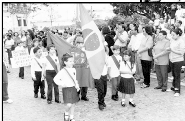
As crianças desfilaram no dia 6 de setembro