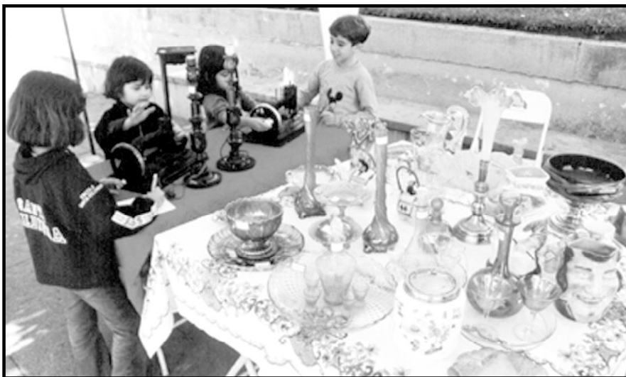
No Valença abre as portas” a participação da criançada despertando a curiosidade