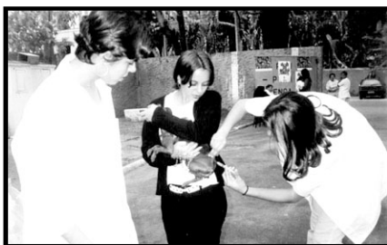
Foram vacinados mais de 12 mil animais

No sábado, dia 22 de setembro, Valença participou efetivamente da Campanha Nacional de Vacinação Anti-Rábica Animal. No período de 8:00 às 17:00 horas estiveram em funcionamento 23 postos de vacinação, em escolas, postos e sub-postos de saúde, igrejas e Câmara, dentre outros locais. Foram vacinados no total 12.742 animais, sendo 11.347 cães e 1.395 gatos.