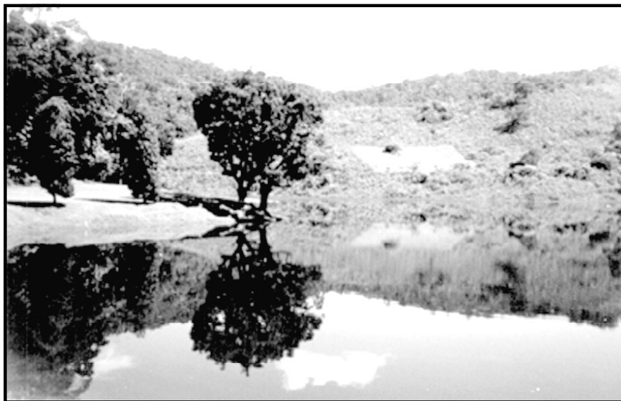
As belezas do Açude da Concórdia agora Parque Natural Municipal

No parque se pretende desenvolver um projeto ecoturístico que ainda está em discussão e elaboração junto ao Departamento de Engenharia do Instituto