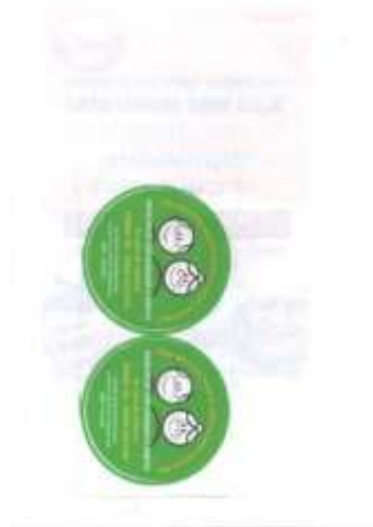
Modelo 50 (Sem modelo completo orçar pela descrição.)