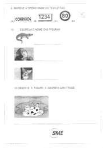
Modelo 28 (modelo físico total disponível na Secretaria de Educação)