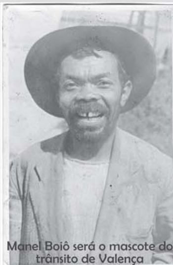
Manel Boiô será o mascote do trânsito de Valença