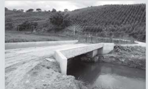
Ponte de Campo Alegre

Passarelas VARGINHA/CANTEIRO HORTO DAS OLIVEIRAS TONLIN