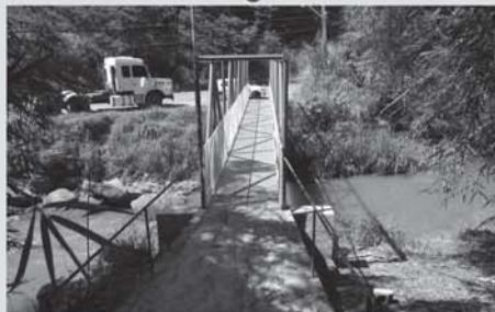
Passarela Horto das Oliveiras

Pontes SANTA INÁCIA SANTO ANTÔNIO CAMPO ALEGRE QUIRINO/JOÃO DIAS PRADO