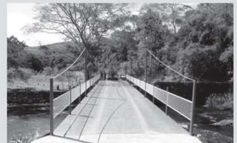
Ponte de Santo Antônio

Pontes SANTA INÁCIA SANTO ANTÔNIO CAMPO ALEGRE QUIRINO/JOÃO DIAS PRADO